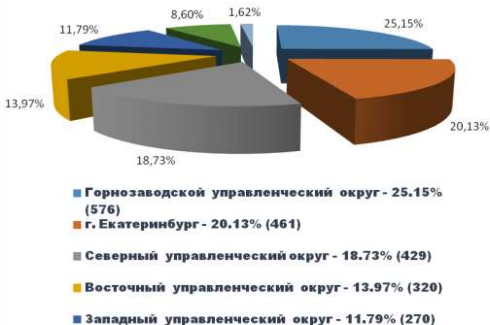
Территории, из которых поступали обращения граждан за 2015 год

Распределение обращений граждан по территориальной принадлежности проживания заявителей представлено на следующей диаграмме.